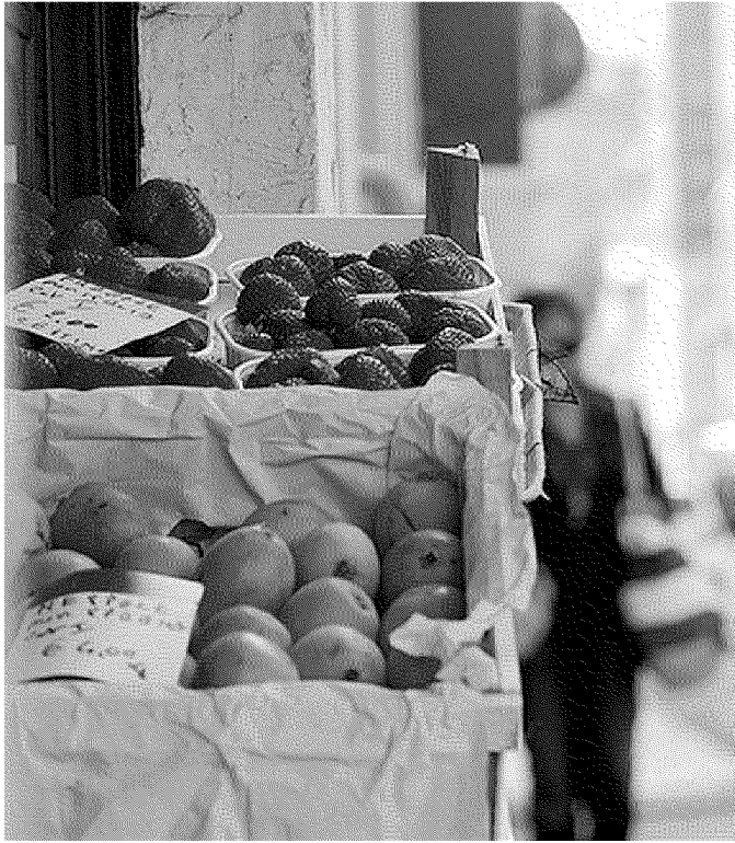
Due fruttivendoli si contendono la fornitura di mele per gli strudel del Papa